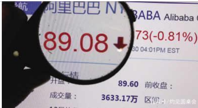
阿里巴巴股价大幅下跌

此外，2012年7月，7家美国律所向新东方发起集体诉讼，指控新东方发布了虚假和误导信息。