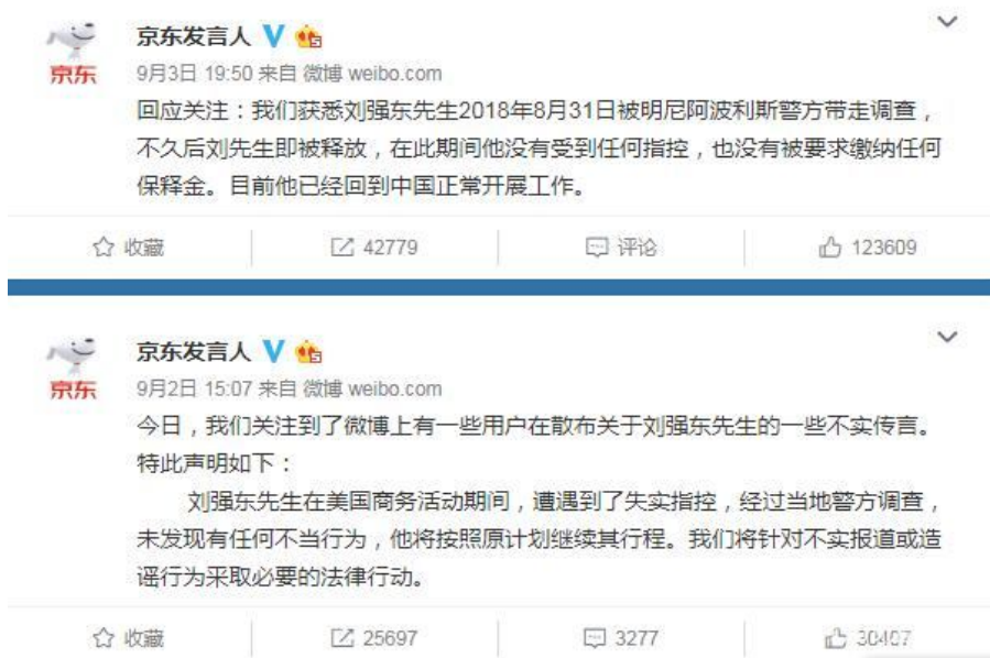
官方账号“京东发言人”的回应

9月2日，网传刘强东在美国明尼苏达州因性侵女大学生被捕后，京东官方在官方微博辟谣，称刘强东遭遇到了失实指控，将针对不实报道或造谣行为采取必要的法律行动。次日，京东方面称刘强东已经回国。在被警方带走调查期间，没有受到任何指控，也没有被要求缴纳任何保释金。